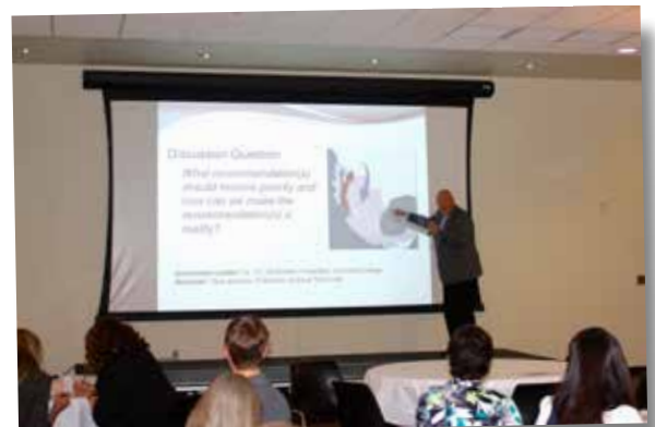
Sierra Vista, AZ